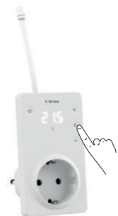
Таблица 1. Навигация по Функциональному меню

Через 5 с после последнего нажатия происходит возвращение к индикации температуры датчика.